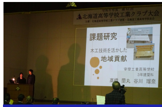
工業部会 課題研究発表大会