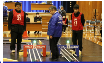
工業部会 マイコンカーラリー