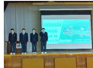
水産部会 水産クラブ研究発表