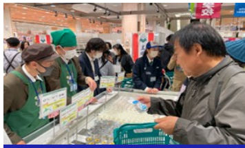
農業部会 食彩フェア