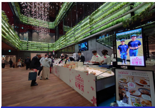
農業部会 東京食彩フェア