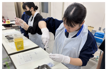
看護部会 母性臨地実習