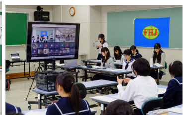
家庭部会 課題研究発表会