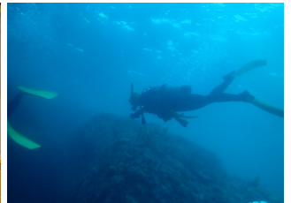
水産部会 潜水実習