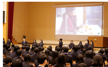
総合学科部会 課題研究発表会