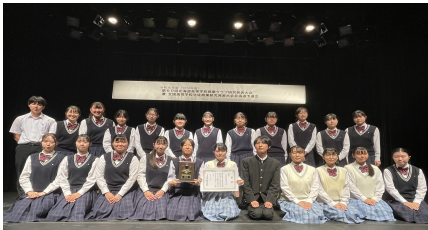
商業部会 商業クラブ発表大会